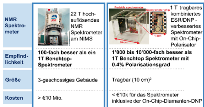
Bild 2: Veranschaulichung der transformativen Eigenschaften der Diamanten-DNP für die NMR-Spektroskopie.