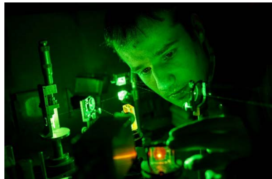
Bild 1: Innovative Nachwuchswissenschaftler treiben die Quantentechnologien voran.

Neben der Durchführung innovativer Forschungsarbeiten ermöglicht die Maßnahme die Bildung von wissenschaftlichen Schwerpunkten und Zentren in der Quantentechnologie sowie eine thematische und personelle Ergänzung der bestehenden Forschungslandschaft. Deshalb unterstützt „Quantum Futur“ auch den Aufbau von Kompetenzen und die Vernetzung der Nachwuchswissenschaftler sowie die Schaffung von Synergien durch die gemeinsame Nutzung vorhandener Geräte und Anlagen.