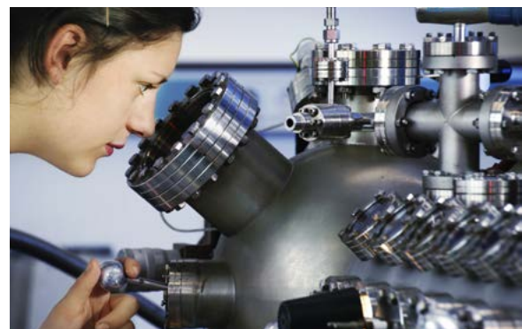
Bild 1: Die apparative Beherrschung von Quantenphänomenen für neue Anwendungen ist derzeit noch sehr kostenintensiv und benötigt hochqualifiziertes Personal.

Die vielversprechendsten Anwendungen der Quantentechnologien sind jedoch kurzfristig nicht praktisch umzusetzen. Es fehlt hierfür die erforderliche Gerätetechnik, die in großen Teilen erst entwickelt werden muss. Die genutzten Quantenphänomene reagieren sehr empfindlich auf äußere Einflüsse und sind daher sehr kurzlebig. Ihre Bereitstellung und Kontrolle ist mit einem beträchtlichen apparativen Aufwand verbunden. Selbst dort, wo man bereits grundlegende Funktionen nachweisen konnte, ist die technische Beherrschung der Quantensysteme noch viel zu kostspielig und zu wenig robust für eine praktische Nutzung. Es gilt daher, in enger Zusammenarbeit zwischen den Herstellern der technischen Ausrüstungen und den Forschern in den Labors neue Geräte für den Einsatz in den Quantentechnologien zu entwickeln. Stabile und kostengünstige Systeme sollen die Aussichten auf eine erfolgreiche wirtschaftliche Nutzung der Quanteneffekte erheblich verbessern. Eine wesentliche Zielstellung der geförderten Projekte liegt darin, einheimische Unternehmen dabei zu unterstützen, sich als weltweit führende Ausrüster für Forschung und Entwicklung zu etablieren.